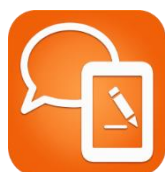
「こえとら」アプリアイコン